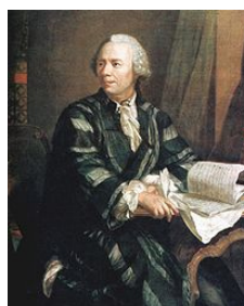
FIGURE 1 – Leonhard Paul EULER

EULER est considéré comme un éminent mathématicien du XVIIIe siècle et l'un des plus grands de tous les temps. Il est aussi l'un des plus prolifiques, et une déclaration attribuée à Pierre-Simon LAPLACE exprime l'influence d'EULER sur les mathématiques : « Lisez EULER, lisez EULER, c'est notre maître à tous ».